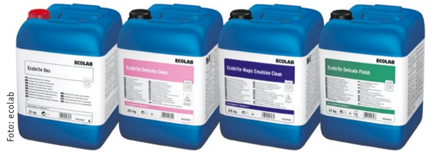
Das Flüssig-Waschmittelprogramm Ecobrite Low Temp von Ecolab für saubere, sichere und effiziente Ergebnisse.

Bei der Entwicklung professioneller Lösungsprogramme für die Textilreinigung und -pflege in hauseigenen Wäschereien stehen nicht nur Sauberkeit und Komfort, Qualität und Sicherheit an oberster Stelle, der Aspekt der Nachhaltigkeit rückt ebenfalls immer mehr in den Fokus. So wie Nachhaltigkeit oft als Gummiwort missbraucht wird und es immer wichtiger wird, genau zu unterscheiden, was wirklich nachhaltig ist und wer sich seiner Verantwortlichkeit für den Weg in eine enkel-