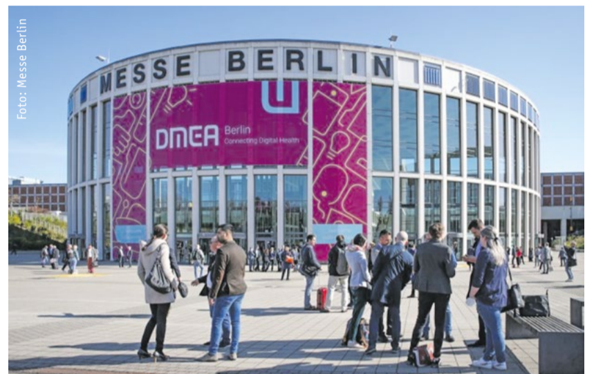
Vom 25. bis 27. April 2023 dreht sich auf dem Berliner Messegelände alles um die Digitalisierung des Gesundheitswesens.

Über drei Viertel der erwarteten 600 Aussteller haben sich bereits für die DMEA 2023 angemeldet. Neben Branchengrößen wie CompuGroup Medical, Dedalus, ID Information und Dokumentation im Gesundheitswesen, medatixx, Meierhofer, nexus AG und Telekom Healthcare Solutions haben sich auch sämtliche anderen wichtigen Player im Markt und zahlreiche Start-ups aus dem In- und Ausland ihren Stand auf der DMEA gesichert. Die Zahl der ausstellenden Start-ups konnte im Vergleich zum Vorjahr fast verdoppelt werden.