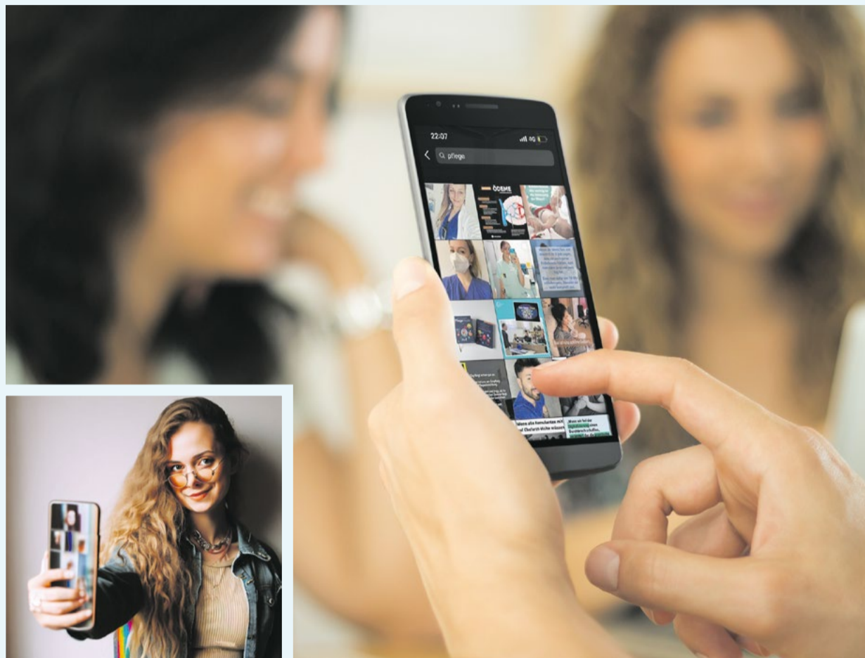
Moderne Mitarbeitende schätzen zunehmend digitalisierte Kommunikation über Social-Media-Kanäle.

Um potenzielle Mitarbeitende auf sich aufmerksam zu machen, ist es für Unternehmen entscheidend, authentische Inhalte zu teilen, die ihre Einrichtungen und Werte widerspiegeln. Die Erstellung eines Redaktionsplans hilft dabei, regelmäßig relevante Beiträge zu veröffentlichen. Beispiele dafür sind der Pflegealltag, Mitarbeitererfolge, Fortbildungsmöglichkeiten und die Arbeitskultur der Unternehmen. Auf diese Weise baut man eine